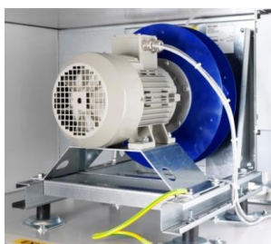
Aplicación: Unidades Tratamiento de Aire Cajas ventilación-extracción Refrigeración / Clima