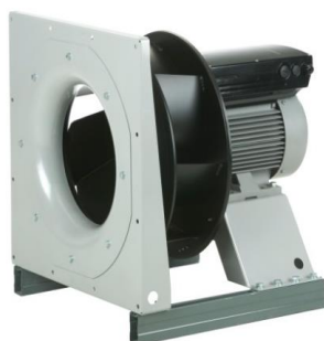
BPFM de Soler&Palau